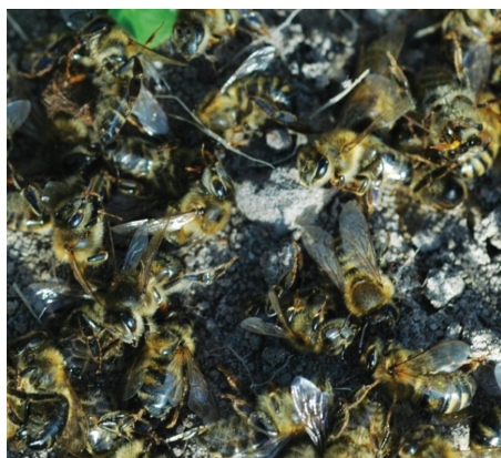
Martwe pszczoły przed ułem.