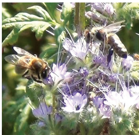
Pszczoła miodna na facelii.

Cennymi dla zapylaczy roślinami dziko rosnącymi są: wierzybki, klony, lipy, jarzębiny, kruszyna pospolita, głogi, tarnina, berberys zwyczajny, malina, wawrzynek wilczczyko, wrzos zwyczajny, borówki, żurawina błotna, mącznica lekarska, nawłóć pospolita, macierzanka piaskowa, lebiodka pospolita, wierzbówka koprzyca, miodunka ćma, trędownik bulwiasty, pajęcznica gałęzista. Ponadto należy także mieć na uwadze następujące rośliny: komonice zwyczajną, groszek żółty, mięte, chaber łąkowy, brodawnik jesienny, ostrożeń, mniszek pospolity, nawłóć późną, oman łąkowy, rdest wężownik, barszcz zwyczajny, kulik zwykły, bodziszek łąkowy, wierzbownicę kosmatą, fioletkę poszarpaną, żywokost lekarski, niezapominajkę błotną, storczyki.