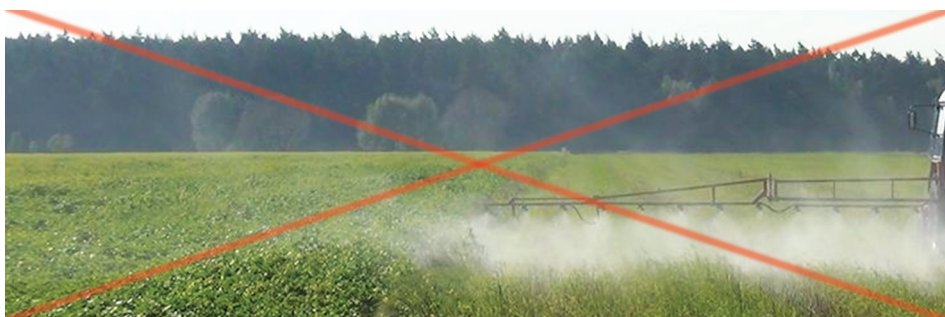
Znoszenie cieczy użytkowej stanowi zagrożenie dla zapylaczy na sąsiadujących plantacjach, na których pszczoły mają pożytek.