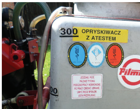
Znak kontrolny na opryskiwaczu potwierdzający jego sprawność techniczną.

W Polsce przestrzeganie zapisów zawartych w etykietach jest obowiązkowe (wyjątkiem są oczywiście podane w etykietach zalecenia np. zalecana dawka środka. W przypadku odstępstw od zaleceń np. zastosowania dawek zredukowanych lub łącznego stosowania agrochemikaliów, które nie są ujęte w etykietach, odpowiedzialność za skutki zabiegu spoczywa na stosującym).