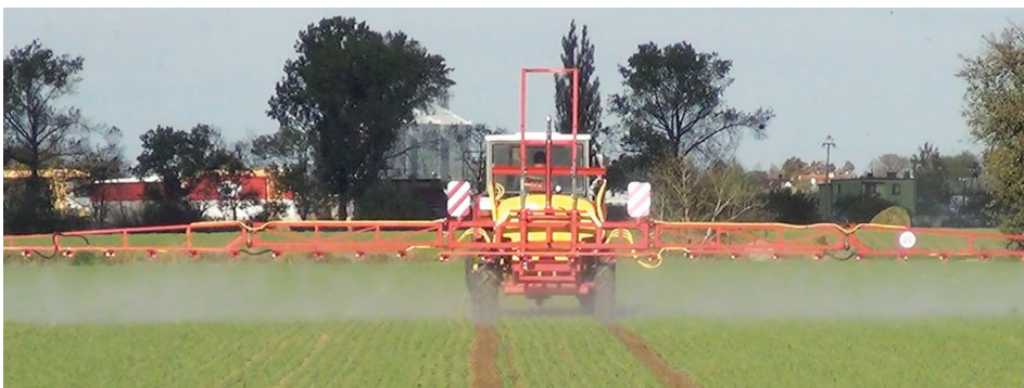
Opryskiwacz w trakcie pracy.

W Polsce liczba zatrutych pni pszczelich w ciągu ostatnich 50 lat uległa znacznemu zmniejszeniu. Mimo to zatrucia pszczoł środkami ochrony roślin są nadal zjawiskiem zbyt częstym. Przyczyną nie jest jednak sama chemiczna ochrona roślin czy brak uwarunkowań prawnych, lecz błędy popełniane przez wykonawców zabiegów czy rolników, ich niedostateczne przygotowanie zawodowe oraz brak świadomości i wiedzy.