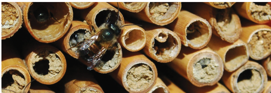
Hodowla murarki ogrodowej.

nieużytki, zadrzewienia śródpolne czy pasy zadrzewień a także kępy krzewów, roślinności niskiej oraz zbiorniki wodne znajdujące się wśród dziko rosnącej roślinności. Obecnie zaleca się aby powierzchnia użytków ekologicznych wynosiła od 5% do 7% całkowitej powierzchni gospodarstwa.