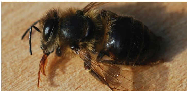
Pszczola miodna zatruta chemicznym środkiem ochrony roślin z charakterystycznie wyciągniętym języczkiem.

i stosowanie w ochronie roślin oraz higienie sanitarnej DDT. Początek stosowania na dużą skalę chemicznych środków ochrony roślin to początek szczególnie niebezpiecznych zatruc pszczół.